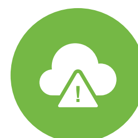
5. Extreme Wetterereignisse