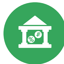
4. Makroökonomische Veränderungen