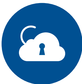
1. Cyber Risiken